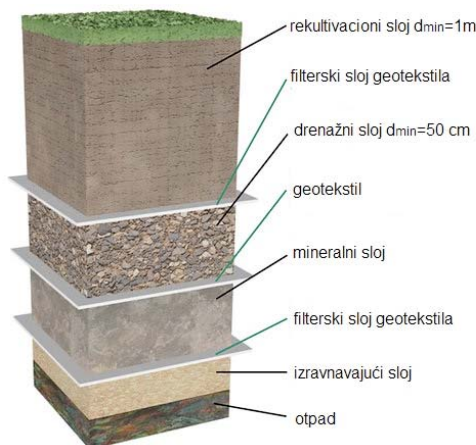
Slika 3. Izgled sistema zaštite gornje površine deponije prema Direktivi 1999/31/EC

Na slici 3 prikazan je izgled sistema zaštite gornje površine deponije prema Direktivi 1999/31/EC [4].