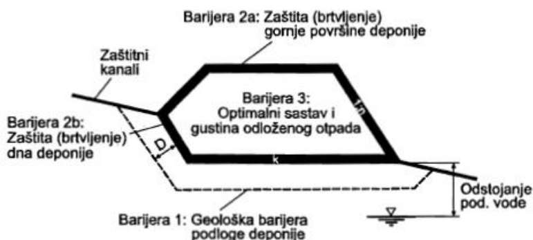
Slika 1. Barijere u kombinovanom sistemu zaštite deponije

Osnovna uloga ovih barijera jeste sprečavanje štetnih supstanci iz tijela deponije u okoliš. Materijali koji se koriste za izradu barijera moraju da zadovolje niz propisanih kriterija među kojima je najvažnija vodonepropusnost, hemijska otpornost, visok kapacitet sorpcije i nizak koeficijent difuzije. Takođe, moraju imati visoku otpornost na oštećenja i deformacije tokom izgradnje i eksploatacije, jednostavnu konstrukciju i nisku cijenu [3].