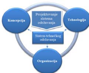
Slika 1. Komponente sistema održavanja

Sistem održavanja tehničkih sistema sl.1 može da se realizuje na više načina, u više međusobno različitih varijanti. Pojedine varijante, odnosno pojedina rješenja sistema održavanja mogu da se razlikuju u nizu detalja, ali i u osnovnim, za sistem bitnim obilježjima. Ovo se odnosi prije svega na koncepciju sistema održavanja, a zatim na primjenjenu tehnologiju i organizaciju. Pod koncepcijom sistema održavanja podrazumijeva se princip donošenja odluka o vremenu u kojem treba da se sprovede postupci održavanja. U ovom pogledu postoje osnovne mogućnosti: preventivno, naknadno i kombinovano održavanje. Kod preventivnog održavanja, potrebni postupci se sprovede prije nego što dođe do pojave otkaza, a kod naknadnog pošto se otkaz već pojavi. Tehnološki aspekt se odnosi na vrstu i način izvođenja postupaka održavanja, a organizacija sistema zavisi od odnosa pojedinih nivoa na kojima se sprovede postupci održavanja tehničkih sistema [1,2,3].