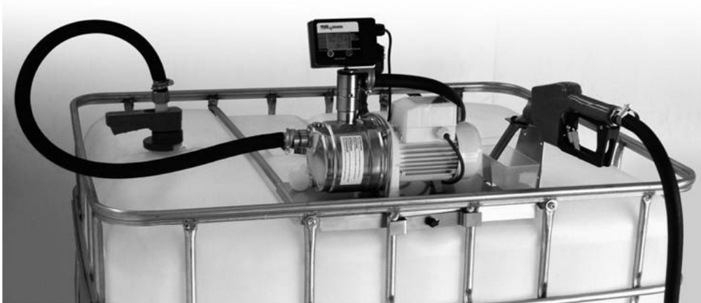
Slika 3. Kontejner od 1000 litara sa pumpom za pretakanje

Budući da za vrijeme skladištenja i korištenja tekućine iz spremnika ne bi trebalo dovesti istu do onečišćenja drugom tvari ili izravnom dodiru sa zrakom, kontejner na vrhu ima veći poklopac i poseban adapter za spajanje crijeva sa pumpom.