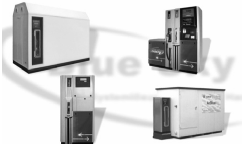
Slika 2. Pumpne stanice za pretakanje AdBlue® različitih kapaciteta

prelazi dopuštene granice za emisije izduvnih gasova, dok će u suprotnom elektronika pokazivati neispravan rad motora. Nova regulacija "Globalna Tehnička Uredba "(GTR) zahtjeve da u budućnosti svi motori koji imaju SCR tehnologiju budu opremljeni ovim sustavima.