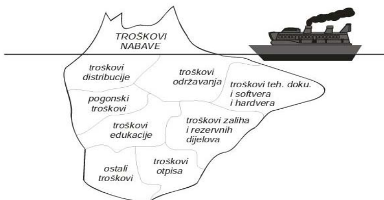
Slika 1. Efekat ledenog brijega u troškovima održavanja [6]

Ukoliko se trošak ne analizira u životnom vijeku sistema, troškovi eksploatacije su obično veći od očekivanih. Loše upravljanje i planiranje s troškovima može se usporediti s "efektom ledenog brijega", koji pliva u moru i kod kojeg je vidljiv samo manji dio (slika 1) [6].